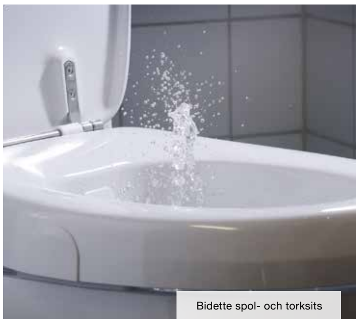
Bidette spol- och torksits