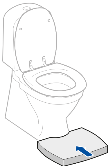
Footpad 5 cm, art. nr. 11 601 (380 x 320 x 50 mm)