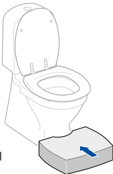
Footpad 10 cm, art. nr. 11 602 (380 x 320 x 100 mm)