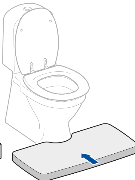
Footpad XL, art. nr. 11 622 (750 x 380 x 50 mm)