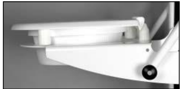
65 mm förhöjd fram och bak

2 st gängstänger med plastmutter, används om sitsen skall monteras på toaletten utan lift.