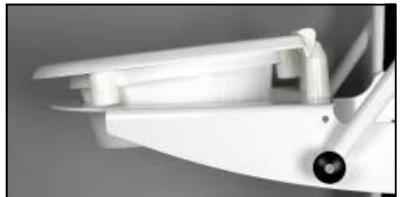
Coxit 4° eller 30 mm lutning