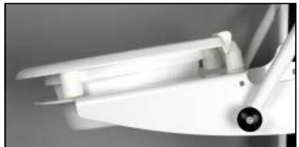
Coxit 9° eller 60 mm lutning

Montera fast den nya sitsen enligt som någon av alternativen