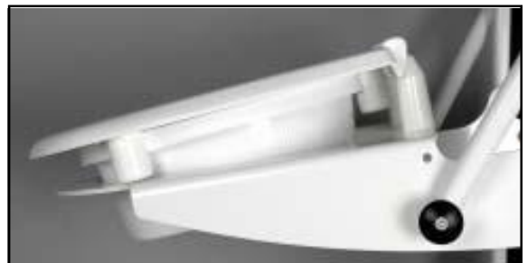
Coxit 13° eller 90 mm lutning